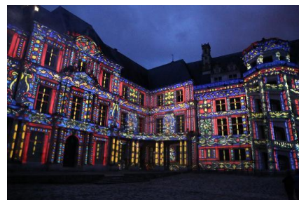
Blois – Son et lumière