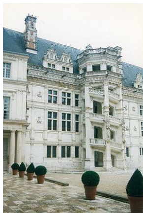
Blois – Château