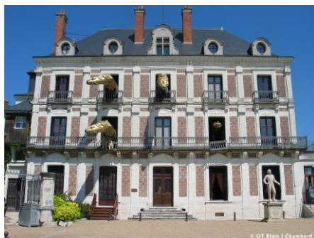
Blois – Maison de la Magie